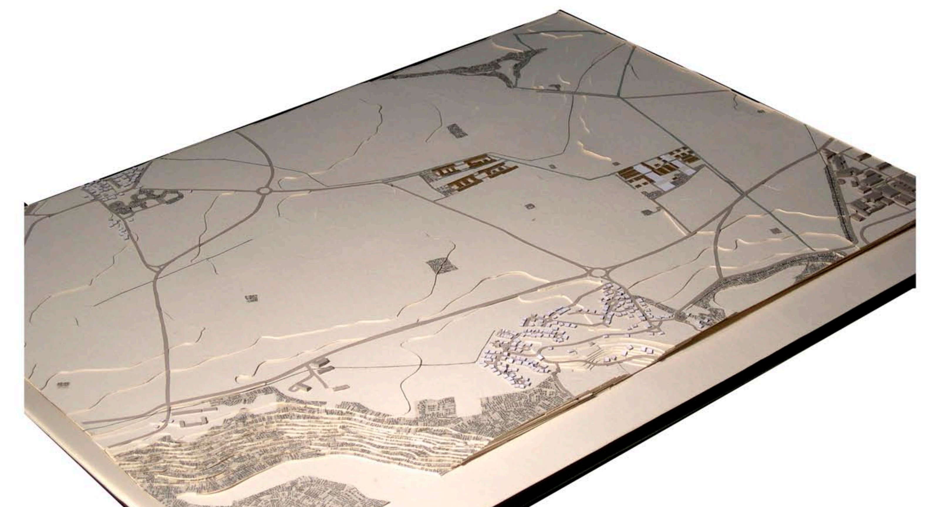
photographie de maquette