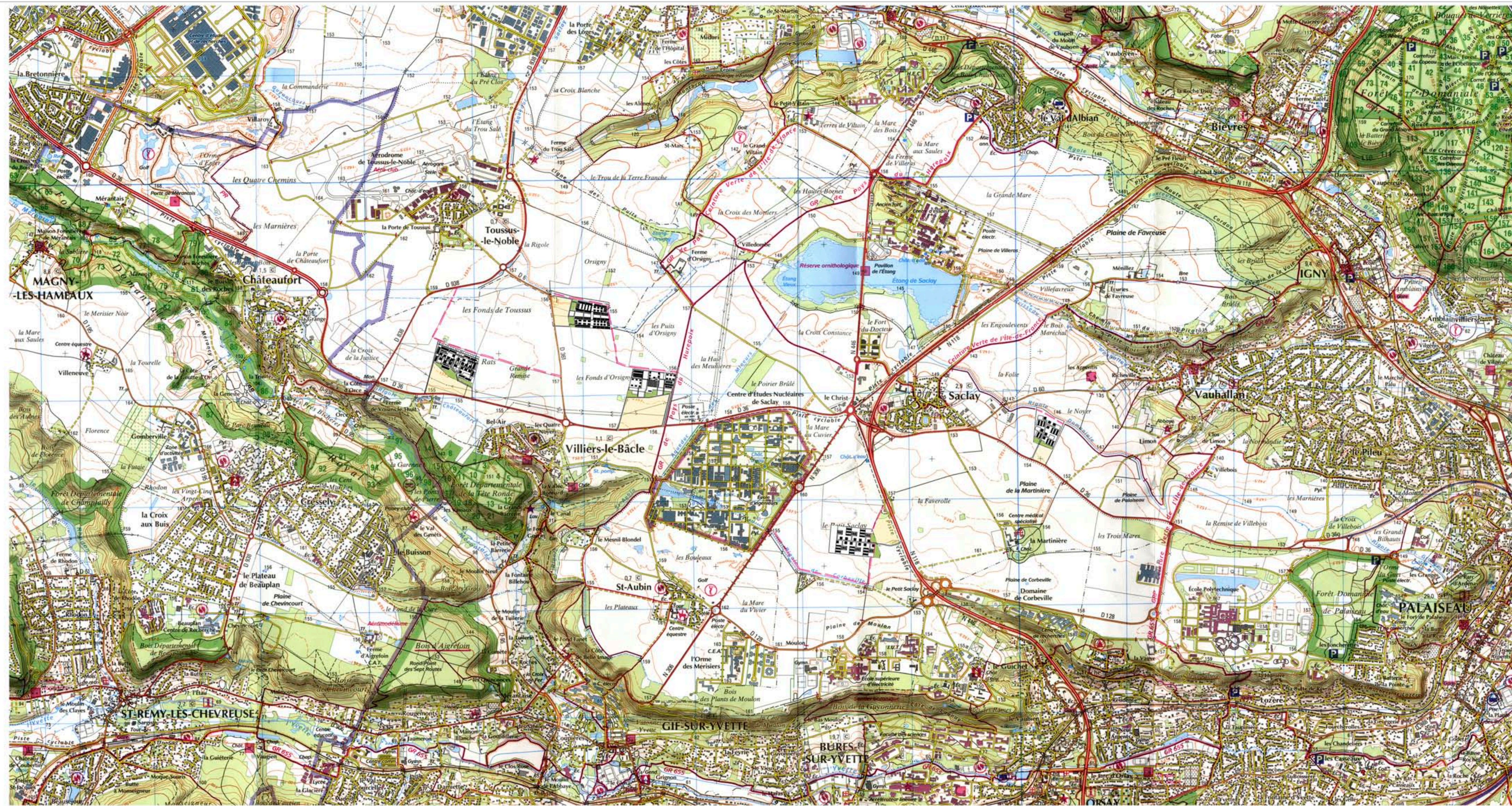
le projet à l'échelle du territoire du plateau échelle : 1/20 000 ème

Ecole Nationale Supérieure d'Architecture de Versailles projet de Master année 2008